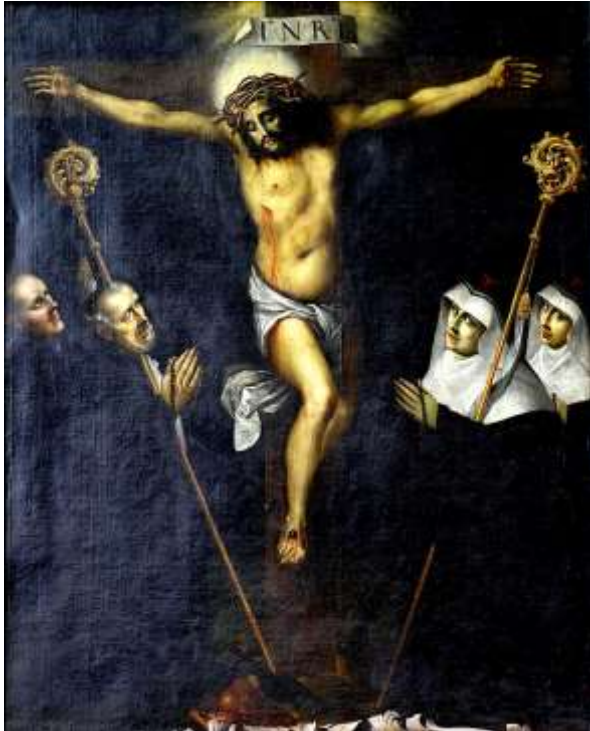
Rysunek 6 Adoracja Chrystusa Ukrzyżowanego przez obie gałęzie zakonu benedyktyńskiego, B. Strobel, 1634 r. z kościoła benedyktynek pw. św. Ducha obecnie kościół św. Jakuba (po lewej stronie u podstawy Krzyża widoczne jabłko symbol zgody)