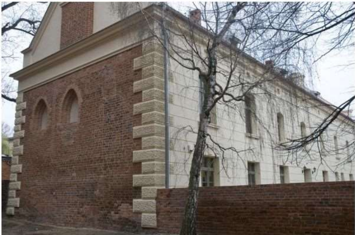
Rysunek 2 Dawny budynek klasztoru sióstr Benedykynek (elewacja północna i zachodnia), ul. Świętego Jakuba 20 a